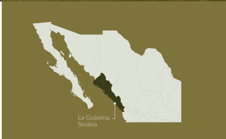
La Guásima, Sinaloa

El Fondo Monte Mojino tiene el objetivo de sostener mecanismos locales para el pago de servicios ambientales a través de fondos concurrentes de la Comisión Nacional Forestal en la región Monte Mojino, al sur de Sinaloa, para asegurar la conservación de la selva tropical subcaducifolia y caducifolia.